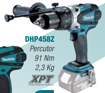
DHP458Z Percutor 91 Nm 2,3 Kg