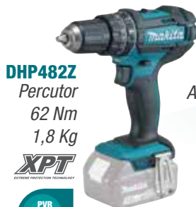
DHP482Z Percutor 62 Nm 1,8 Kg