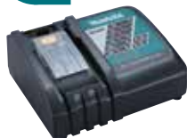
DC18RC Cargador rápido.