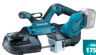
DPB181Z Sierra de banda 3,2 m/min 3,5 Kg