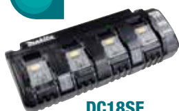
DC18SF Multicargador de 4 puertos.