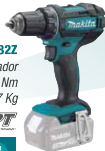
DDF482Z Atornillador 62 Nm 1,7 Kg