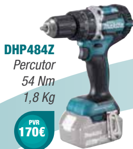
DHP484Z Percutor 54 Nm 1,8 Kg