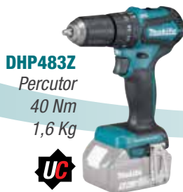
DHP483Z Percutor 40 Nm 1,6 Kg