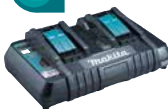
DC18RD Cargador rápido de 2 puertos.