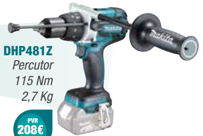
DHP481Z Percutor 115 Nm 2,7 Kg