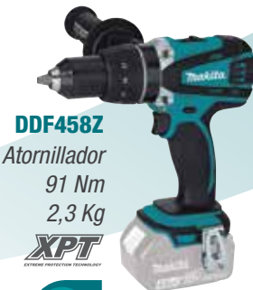
DDF458Z Atornillador 91 Nm 2,3 Kg