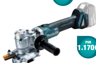
DSC250ZK Cortador de varilla 10-25 mm 3,9 Kg