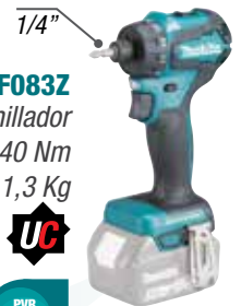
DDF083Z Atornillador 40 Nm 1,3 Kg