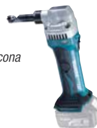
DJN161Z Roedora 1,2 mm 2,2 Kg