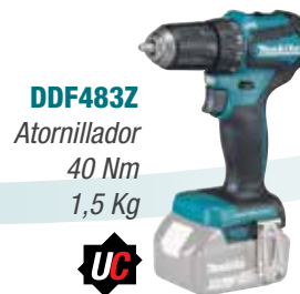
DDF483Z Atornillador 40 Nm 1,5 Kg