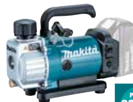
DVP180Z Bomba de vacío 3.840 rpm 3,5 Kg