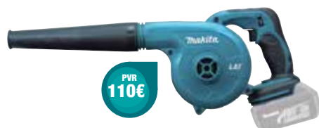
DUB182Z 0-18.000 rpm 2,6 m³/min 1,8 Kg