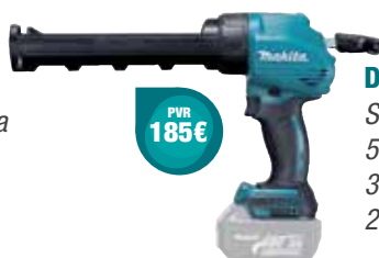
DCG180Z Sellador de silicona 5.000 N 300 ml 2,3 Kg