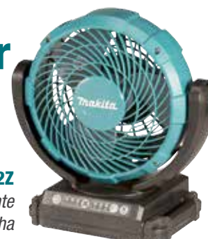
DCF102Z Balancea automáticamente 45° a izquierda y derecha 3 m/seg 1,3 Kg