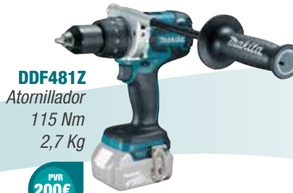
DDF481Z Atornillador 115 Nm 2,7 Kg