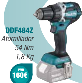
DDF484Z Atornillador 54 Nm 1,8 Kg

XPT BL EXTREME PROTECTION TECHNOLOGY MOTOR